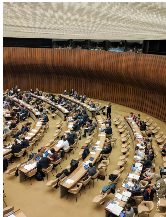
Abb. 2 Rüstungskontrollgespräche zu Autonomie in Waffensystemen bei den Vereinten Nationen in Genf.

Um qualitative Rüstungskontrolle weiter zu entwickeln sind zwei Schritte nötig: Erstens, alte Silos müssen aufgebrochen und der größer werdenden Schnittmenge zwischen konventionellen auf der einen und Massenvernichtungswaffen auf der anderen Seite Rechnung getragen werden. Zweitens, Rüstungskontrolle muss sich auch für die eigenen Zwecke neuer Technologien entschlossen zuwenden. Die ersten Versuche dafür sind zwar noch zaghaft, aber zahlreich: Auf maschinellem Lernen beruhende Bilderkennungsverfahren können Minen auf Bodenradarbildern, unter Exportkontrolle fallende Komponenten oder, in Kombination mit Distributed-Ledger -Technologien (vulgo Blockchain), Verstöße in Atomanlagen gegen Safeguards der Internationalen Atomenergie-Organisation erkennen. Kommerzielle Anbieter von Satellitenbildern liefern inzwischen bis zu zwei Aufnahmen von jedem Ort der Erde täglich: Solche Open Source Intelligence erlaubt Verifikation wie sie früher nur Nationalstaaten vorbehalten waren. Kurz, Rüstungskontrolle wird im 21. Jahrhundert nur dann noch eine Rolle spielen, wenn sie neue Technologien nicht nur als Regulierungsgegenstand, sondern stets auch als neues ermöglichendes Hilfsmittel betrachtet. 📌