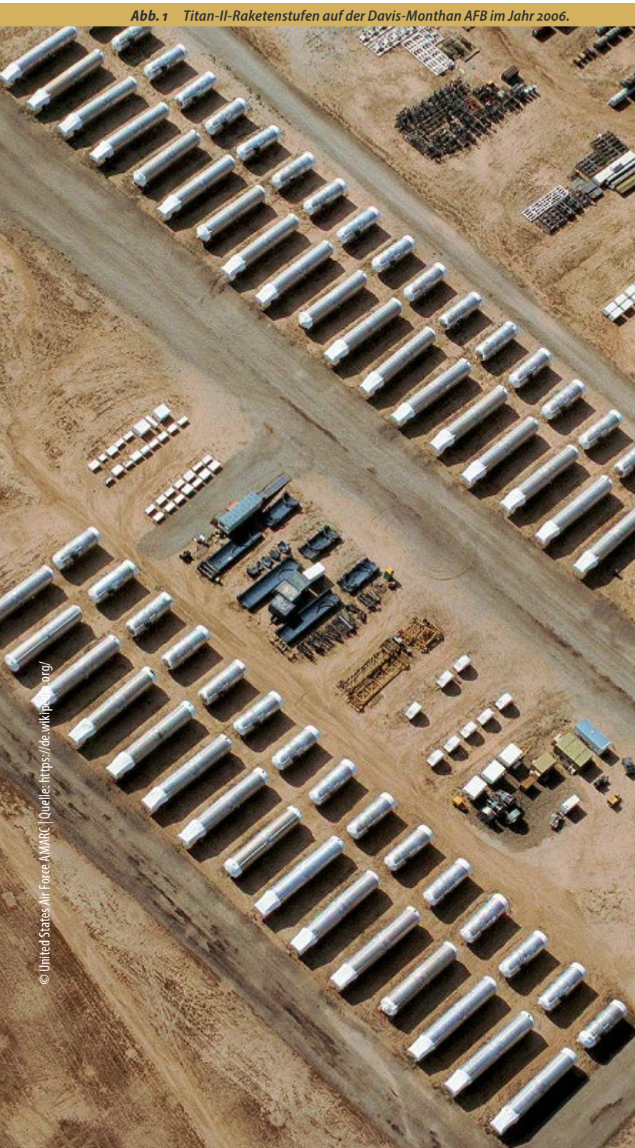
Abb. 1 Titan-II-Raketenstufen auf der Davis-Monthan AFB im Jahr 2006.

Die klassische Rüstungskontrolle stellte Verifizierbarkeit über ein quantitatives Paradigma her. Sie definierte technisch einzugrenzende (Kategorien von) Waffen und zählte, begrenzte, reduzierte oder verbot diese. Das Vorhandensein zählbarer Einheiten war, ist und bleibt in vielen Bereichen der Rüstungskontrolle der Schlüssel zu funktionierender Verifikation. Dies gilt für die konventionelle, aber auch die nukleare Rüstungskontrolle, für Anti-Personen-Minen wie für Nuklearsprengköpfe. Man könnte sagen: Zählbarkeit schafft Transparenz schafft Überprüfbarkeit schafft Kontrolle.